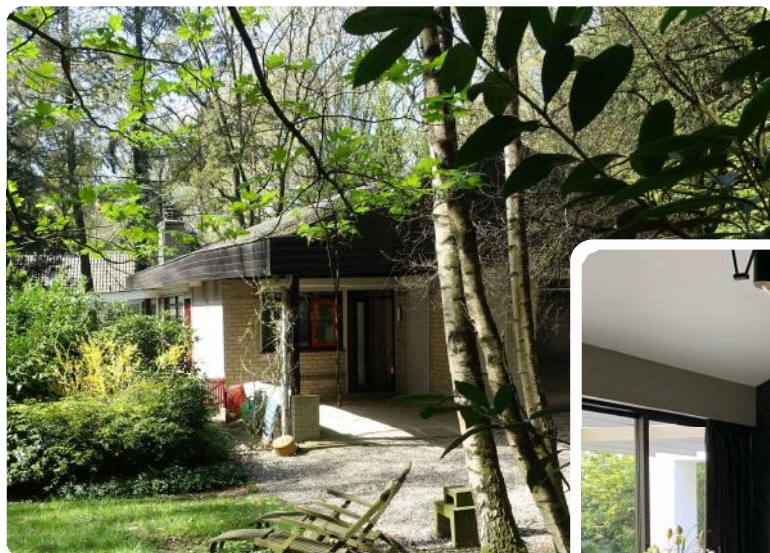
Oorspronkelijk vakantiewoning in originele staat.

Ons voorstel was om een 'zwevend' terras van ca. 5 x 16 meter te maken over de gehele breedte van de woning. Aan de korte zijden van dit terras hebben we wit gestucte wanden geplaatst, welke tevens de kopgevels van de woning omvatten. Hierdoor is de woning optisch vergroot, en oogt het als een moderne witte villa in de bosrijke omgeving.