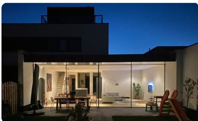
Nachtopname nieuwe woonkamer

Het project is door Bouwbedrijf Kok uit De Meern vakkundig uitgevoerd. Wij wensen de familie veel woonplezier in hun vernieuwde woning.