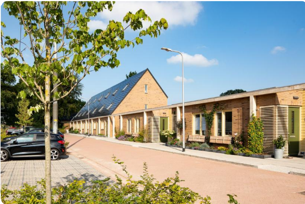
starterswoningen en zorgpatiowoningen

In oktober 2020 zijn de 7 starterswoningen en 8 zorgpatiowoningen aan de Wellingtonweg te Austerlitz opgeleverd, en overgedragen aan de stichting Nu voor Straks. Alle woningen hebben het NOM certificaat. De zorgpatiowoning voldoen daarnaast ook aan het Woonkeur Pluspakket Zorg. Inmiddels zijn de woningen ingericht, en zijn de bomen en het groen aangeslagen. Reden om fotograaf Norbert Waalboer te vragen een fotoreportage te maken van dit unieke bouwproject. Hij heeft de bedoeling van ons plan prachtig in beeld gebracht, met behulp van mooi zonnig weer.