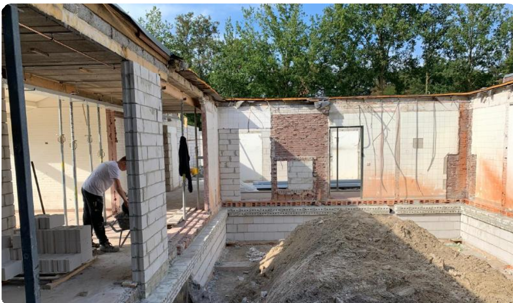
Patio bij Poelzijde

Ter Braak Architecten heeft voor dit project ook het interieurontwerp verzorgd. Om de keuzes inzichtelijk te maken voor de zorg en alle betrokkenen, is voor dit project een zogenaamde proefkamer gemaakt. Deze kamer met sanitaire ruimte is volledig afgewerkt en ingericht met de gekozen materialen voor vloer, wand en plafond inclusief de sanitaire toestellen. De proefkamer werd met enthousiasme bekeken en beoordeeld door de zorg, maar bracht ook enkele aandachtspunten naar voren welke in het definitieve plan verwerkt zijn.