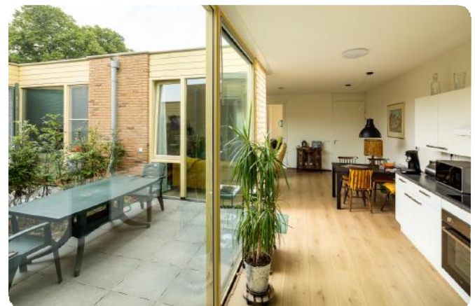
Foto van de keuken met patio

De foto's geven een goed beeld van het ruime en lichte interieur, door de plaatsing van de patio midden in de woning. De volledige fotoreportage is terug te vinden op onze website.