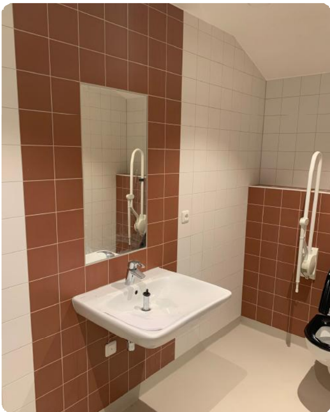
Foto badkamer bij proefkamer

Ter Braak Architecten heeft voor dit project ook het interieurontwerp verzorgd. Om de keuzes inzichtelijk te maken voor de zorg en alle betrokkenen, is voor dit project een zogenaamde proefkamer gemaakt. Deze kamer met sanitaire ruimte is volledig afgewerkt en ingericht met de gekozen materialen voor vloer, wand en plafond inclusief de sanitaire toestellen. De proefkamer werd met enthousiasme bekeken en beoordeeld door de zorg, maar bracht ook enkele aandachtspunten naar voren welke in het definitieve plan verwerkt zijn.